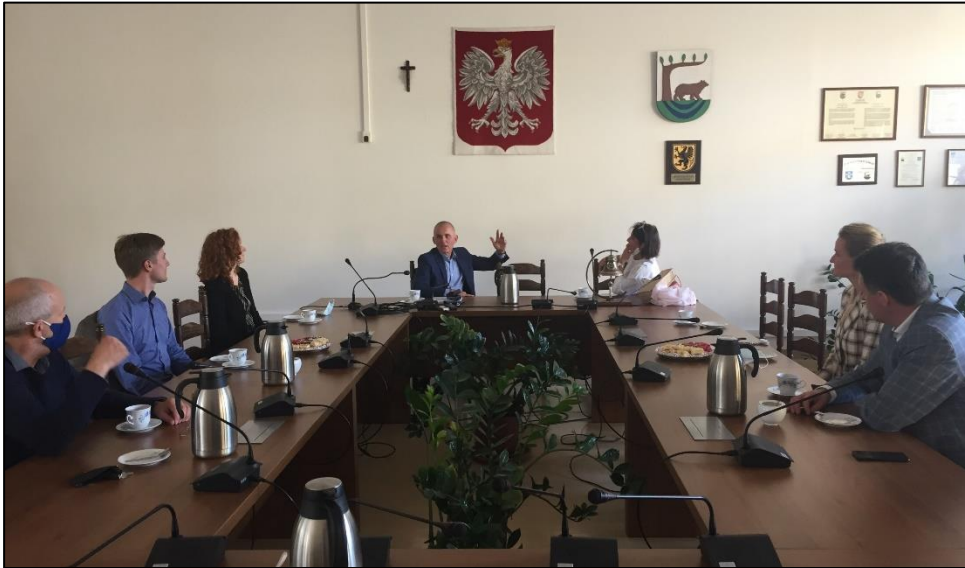
Vertreter*innen aus Marburg-Biedenkopf und Kościerzyna im Gespräch mit dem Bürgermeister der Gemeinde Kościerzyna, Grzegorz Piechowski.

Gemeinde wurden zudem zwei Photovoltaik-Freiflächen mit jeweils 5 MW und 1,5 MW Leistung installiert. Die Stadt und die Gemeinde Kościerzyna übernahmen gemeinsam 40 Prozent der Finanzierung, die Europäische Union kam für die restlichen 60 Prozent auf.