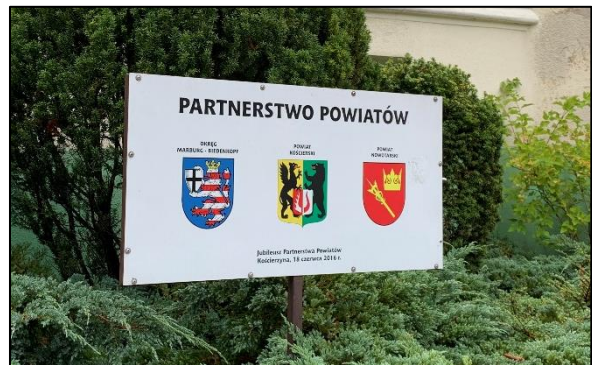
Die Partnerschaft der Landkreise besteht seit 15 Jahren.

Am Morgen des ersten Tages wurde die Delegation im Landratsamt der Stadt Kościerzyna von der Landrätin Alicja Żurawska in Empfang genommen. Sie betonte, sehr zufrieden zu sein, dass der Städteaustausch nun nachgeholt werden könne, da er dem Wissensaustausch diene, um auf beiden Seiten die Energiewende voranzubringen. Polen habe nun den Kohleausstieg bis zum Jahr 2049 beschlossen. Kościerzyna sei daher bestrebt, den Ausbau erneuerbarer Energien vor Ort zu beschleunigen. Der an die Ostsee angrenzende Landkreis verfügt unter anderem über große Windkraftpotenziale, ausreichend Freiflächen für Photovoltaik-Anlagen sowie nachwachsende Rohstoffe zur Energiegewinnung.