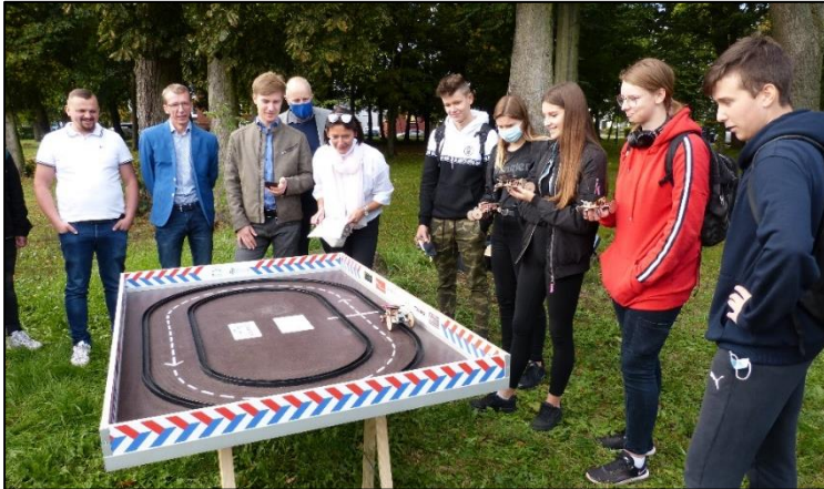
Auf der Rennstrecke drehen die SolarCup-Autos ihre Runden.